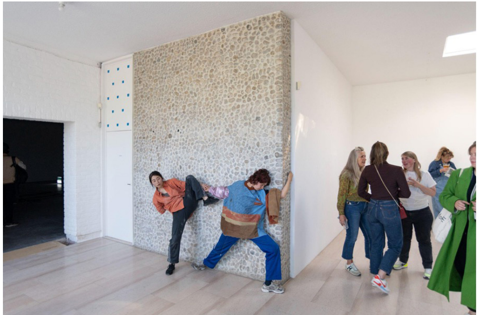
Networked Collective, It is part XXX of an ensemble, and this ensemble is no longer necessarily ceremonial , Museum Dhondt-Dhaenens, 1 juni 2022.

Van 6 tot en met 8 oktober 2023 organiseert KASK & Conservatorium een Autumn Academy in Museum Dhondt-Dhaenens (MDD) vanuit het project Nomadic School of Arts. Het gehele museum en de Beeldentuin wordt gedurende dat weekend beschikbaar gesteld aan 15 studenten van alle richtingen binnen KASK & Conservatorium.