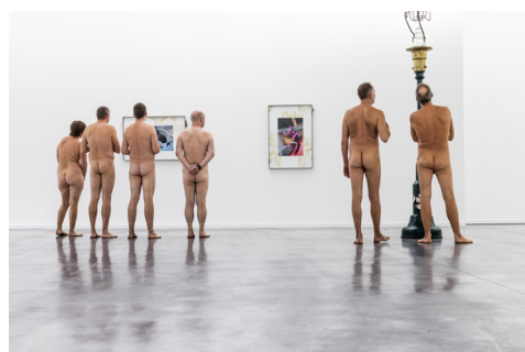
Naked Freedom in Museum Dhondt-Dhaenens, 2022.