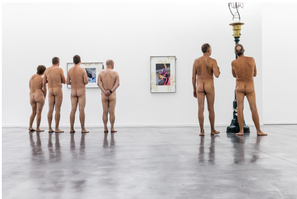
Naked Freedom in Museum Dhondt-Dhaenens, 2022.

Museum Dhondt-Dhaenens organiseert op vrijdag 25 november om 18:00 zijn eerste naakte nocturne ter ere van de installatie Mirror Mirror (2022), een permanent kunstwerk van Yvan Derwéduwé in de toiletten van het museum.