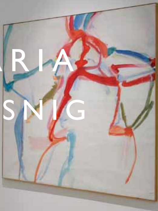
Härlin - Selbstporträt, 1960/61