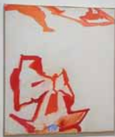
Die blaue Blume der Romantik, 1961