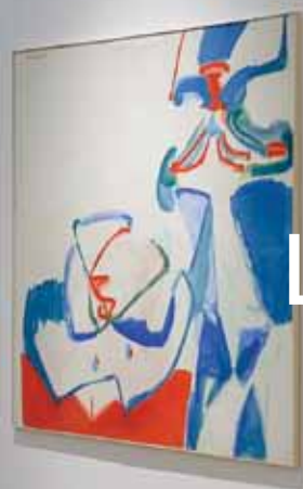
Körper und Gesicht (Körper), 1961