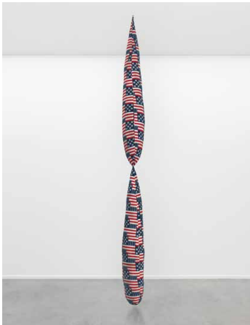
STERLING RUBY RWB DROPS (4217) _ 2013 Fabric and fiber fill 492,8 x 50,8 x 25,4 cm