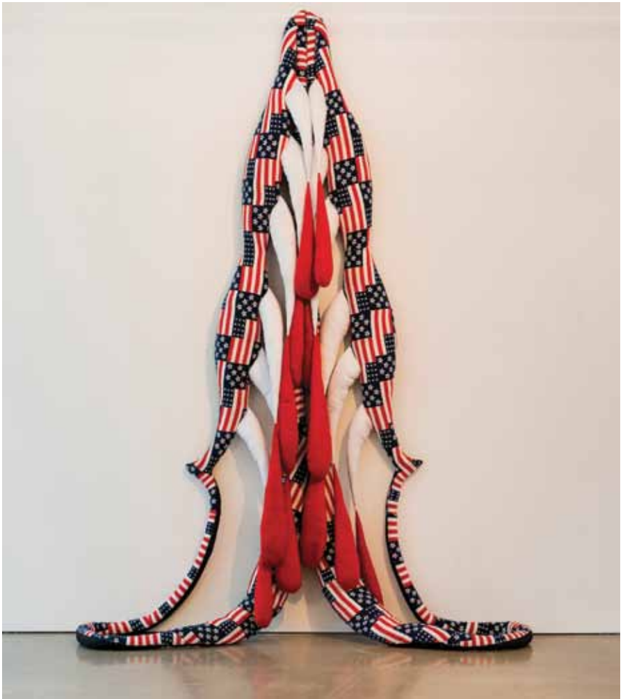
STERLING RUBY VAMPIRE FLAG (RWB) _ 2011 Fabric and fiber fill 348 x 335,3 x 520,7 cm