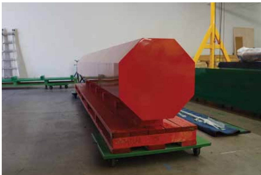
STERLING RUBY Stop Block _ 2013 (production) Power coated stainless steel 127 x 457,2 x 61 cm