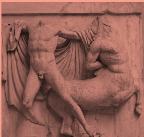
Lapith fighting a centaur, South Metope 27, Parthenon, ca. 447-433 BC, collection British Museum