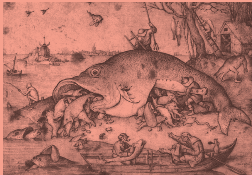
Pieter Bruegel the Elder, Big Fishes Eat Little Fishes , Graphische Sammlung Albertina