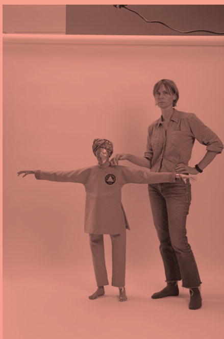
Francis Upritchard &amp; New Life, 2018, courtesy the artist &amp; Kate MacGarry, London