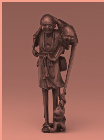
Netsuke of Ashinaga and Tenaga with an Octopus, 18th century Japan, collection The Metropolitan Museum of Art