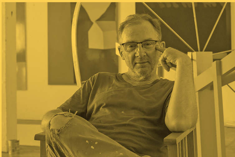
Gary Hume