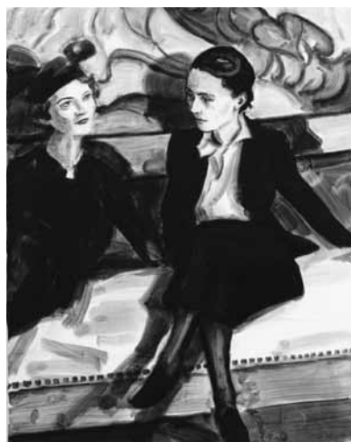
Elizabeth Peyton, Elizabeth and Georgia (Elizabeth Arden and Georgia O'Keeffe 1936), 2005

sieve verftoets en krachtige lijnvoering. Door het eenvoudigen van het beeld wou hij in zijn tekeningen en schilderijen tot een vorm van essentie komen, zonder echter te vervallen in een afgewogen methodiek. Kunstcriticus André De Ridder schreef dat schilderen bij Permeke een daad is waarbij hij telkens alles op het spel zet. Permeke waagde zich inderdaad niet aan hoogdravende theorieën maar benaderde schilder-