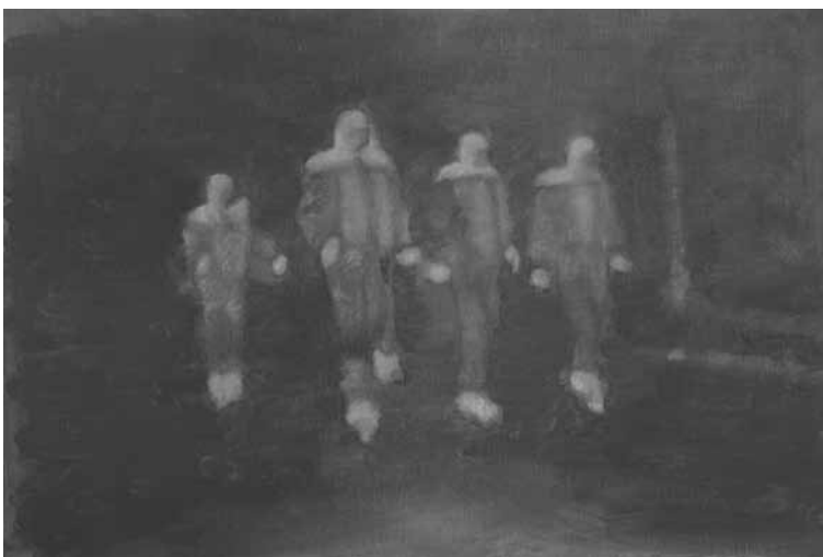
Luc Tuymans, Mardi Gras, 2004

incorporating silkscreen printing and photographic procedures, profoundly affected the further development of painting.