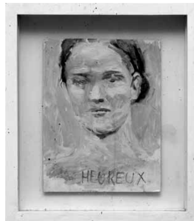
Michaël Borremans, Sad Girl, 1996

Because of his inspirational role for many contemporary artists, Léon Spilliaert was an obvious choice for this exhibition. Both his painterly approach and the subject matter in his work make Spilliaert particularly contemporary. The photographic aspect of his work announces many of today's approaches. From its inception, photography has been strongly influenced by painting, especially in a genre