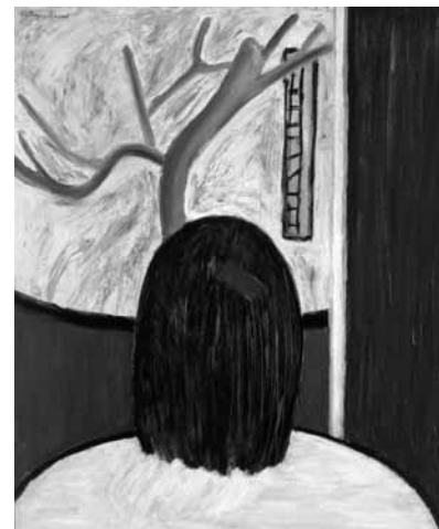
Roger Raveel, Mens en boom, 1954

La fascination de la peinture pour les célébrités contemporaines se cristallisa définitivement dans les années 1960, avec Andy Warhol. Leaders politiques, vedettes de cinéma, musiciens et artistes célèbres