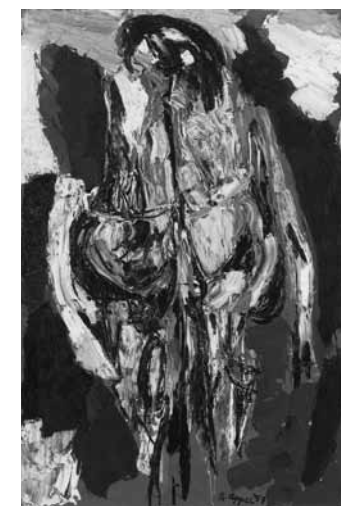
Karel Appel, Blauw Naakt, 1957

The work of Dutch artist Karel Appel (1921–2006) came to full development in the years after World War II. He acquired fame and notoriety for his paintings that depict human and animal figures in bright colours, often with heavy outlines. These show an affinity with children's drawings, but also with outsider art and ethnic art. From the 1950s, Karel Appel started to paint with increasingly thicker paint and his work became even more