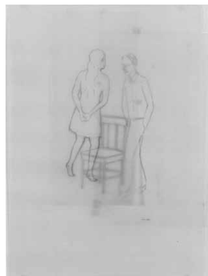
Francis Alÿs, Untitled (Musical Chair), 2006

is vooral bekend door zijn efemere interventies met een sociale dimensie, vastgelegd op video en vrij te downloaden op zijn website www.francisalys.com . Veel van die acties doen denken aan de absurde arbeid van de mythologische held Sisyphus, die telkens opnieuw, tot in het oneindige, een