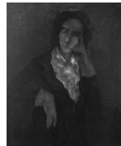
Constant Permeke, Dame met rode handschoenen, 1949

The disproportionate and robust representation of the human body in the work of Constant Permeke (1886–1952) served to represent a fierce primal power. His farmers, sailors and nudes acquire a monumental presence through the expressive paint strokes and powerful lines. Through the simplification of the image, he wanted to uncover, in his drawings and paintings, some form of essence, without however following a preconceived methodology. Art critic André De Ridder wrote that for Permeke, painting is always an act in