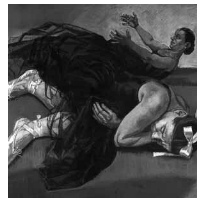
Paula Rego, Dancing Ostriches from Disney's Fantasia, 1995

The work of Neo Rauch (b. 1960) is strongly influenced by his art training in East German Leipzig in the 1980s. Social Realism, the heroic figurative art style that served the communist propaganda system, had a major influence on his use of colour, formal language, and compositional structure. Neo Rauch, however, does