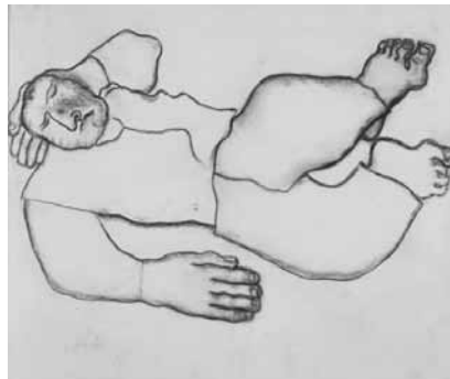
Constant Permeke, Liggende boer, ca. 1928-29