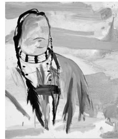
Emilio Lopez-Mencherero, In Russel Means Mind, 2011

Michaël Borremans est également représenté à travers deux œuvres: le déjà plus vieux Sad Girl , 1993 et le plus récent Red hand, Green hand (2) , 2010, qui montre clairement l'évolution que l'artiste a connue. Ces deux peintures présentent également un regard difficile à cerner et étonnant sur l'Homme et l'environnement dans lequel il s'inscrit. Au vu de son statut de source d'inspiration pour de nombreux artistes contemporains, Léon Spilliaert était un choix évident