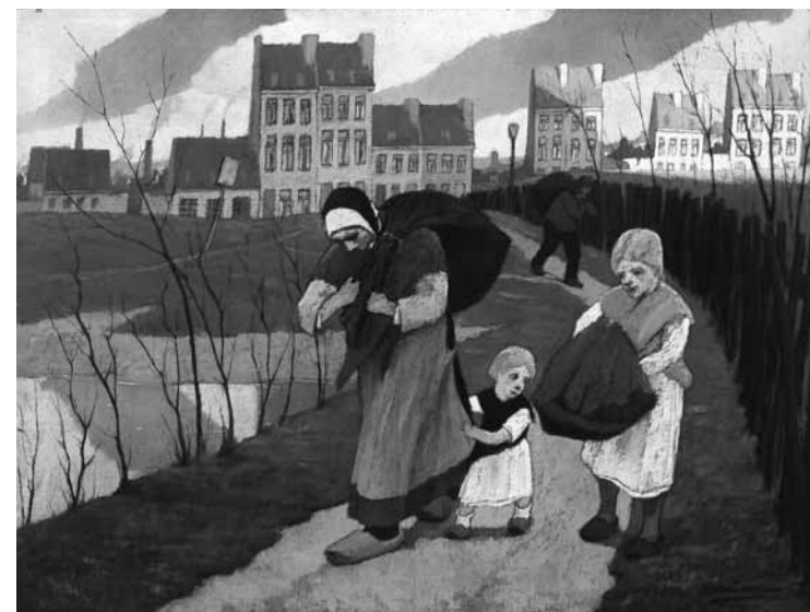
Eugène Laermans, De voddenrapers, 1914

to Sander. In this exhibition, we illustrate this through the works of Thomas Struth and Christopher Williams.