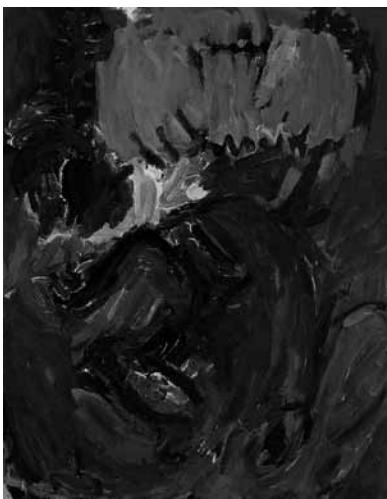
Georg Baselitz, Blaues Akkordeon, 1985

For all its temporary exhibitions, the Raveelmuseum takes the broad framework of Raveel's