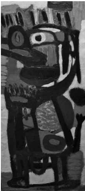
Karel Appel, Tribal Chief, 1951