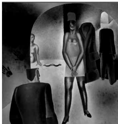
Frits Van den Berghe, Gangen, 1927