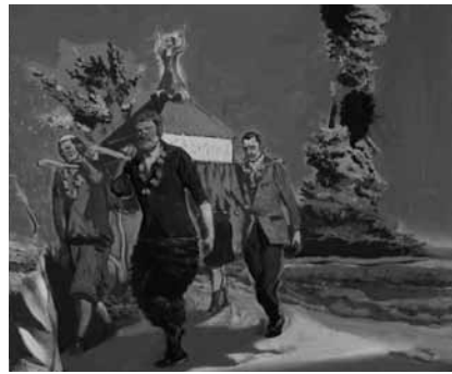
Neo Rauch, Prozession, 2010

L'artiste américaine Elizabeth Peyton (*1965) a connu la notoriété dans les années 1990 pour ses portraits peints en petit format et souvent marqués par des touches de couleurs vives. Elle représente des personnages historiques, des célébrités du monde de la musique, de l'art et de la mode, de même que des amis et des proches. Ce qui surprend toutefois est que ses modèles n'adoptent pas une pose fière et déterminée, mais qu'ils sont, au contraire, représentés très vulnérables ou rêveurs, comme si leur portrait avait été réalisé pendant un moment d'intimité. Ils apparaissent également toujours à la mode, jeunes et minces, souvent affublés d'un nez étroit et de lèvres rouge vif, ce qui leur donne une allure androgynous. Elizabeth Peyton ne réalise aucun portrait sur commande, mais choisit ses modèles selon la fascination personnelle qu'ils lui inspirent. Elle s'inspire aussi de photos et ne connaît pas toujours personnellement les personnages qu'elle représente, même si elle donne l'impression d'avoir un rapport affectueux et intime avec eux.