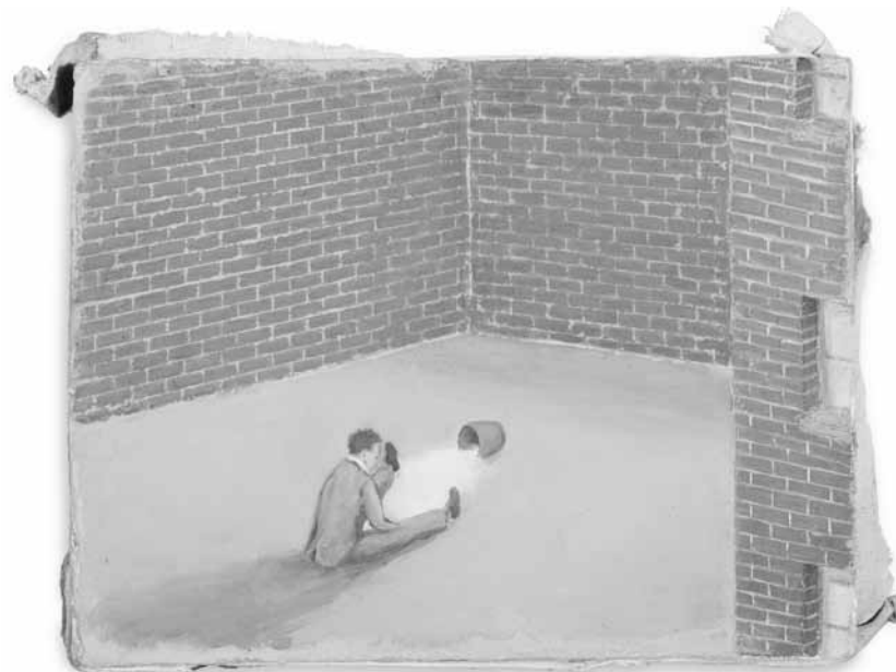
Francis Alÿs, Man with bucket, 1995

De Belgische, in Mexico City residerende, kunstenaar Francis Alÿs (*1959)