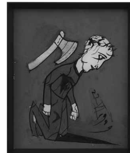
Florin Mitroi, 22.VI.1989, 1989

at a time when the communist regime in his country advocated social realist art in the service of propaganda. Only art that conformed to the canon of the Communist leaders was recognized. More modernist art forms were ignored, although not prohibited, as long as the prevailing political system was not questioned. Florin Mitroi, in this way, developed his oeuvre in a discreet manner, without ever being able to exhibit his work. After the fall of the Iron Curtain he curiously chose to keep his work away from the public eye, with the exception of a solo exhibition in Bucharest in 1992. His work is a continuous reworking of the theme of human helplessness and betrays his own unsociable attitude. Feelings of fear, doubt, abuse, betrayal and danger are usually insinuated in an implicit manner, and sometimes explicitly represented by means of a knife, a sword or an axe. The true value of his work only became apparent after his self-chosen death in 2002, when hundreds of works on canvas, wood, glass and paper were discovered in his studio.