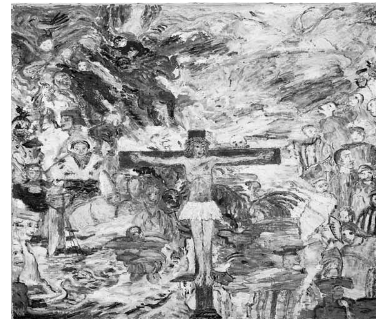
James Ensor, Christus aan het kruis, 1931

Dat de menselijke figuur ook op een sterk geabstra-