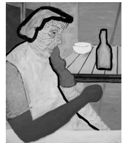
Roger Raveel, Vrouw met rode arm, 1949-51

dit schilderij met de geïntegreerde bedstijlen is hij er in geslaagd om het moment van het heengaan op een onnavolgbare plastische wijze uit te drukken. Een andere manier om de dood voor te stellen vinden we bij Walter Swennen, wiens Sans titre (tête de mort/crâne) , 1987, enigszins naar