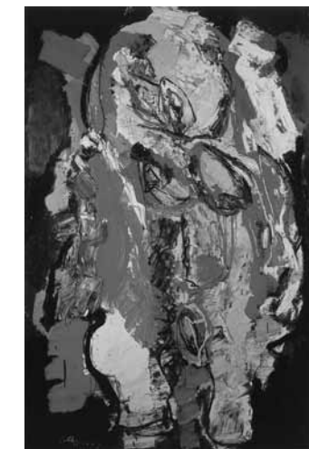
Karel Appel, Barbaars Naakt, 1957

uncontrolled. Appel applied paint to the canvas with thick brushes, putty knives and his bare hands. Sometimes he even threw whole pots of paint onto the canvas. The coherence of colour and form disappeared and the composition was developed through the act of painting itself, without first determining what exactly the work was supposed to represent. Even though it became increasingly difficult to deduce what the compositions suggested, Appel continued to regard his work as figurative art. The main motif in the exhibited works is the creation of an image of man charged with an untamed