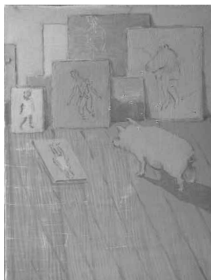
Francis Alÿs, Pig in Cabinet, 2004

mythologique Sisyphe, dont la punition était de faire remonter un lourd rocher vers le sommet d'une montagne, ce dernier redescendant toujours au point de départ. Les actions entreprises par Alÿs ne sont, cependant, pas des formes déprimantes ou gratuites de résistance critique, mais génèrent, au contraire, un regard généreux et plein d'espoir sur le monde. Les peintures et les dessins, certes moins connus,