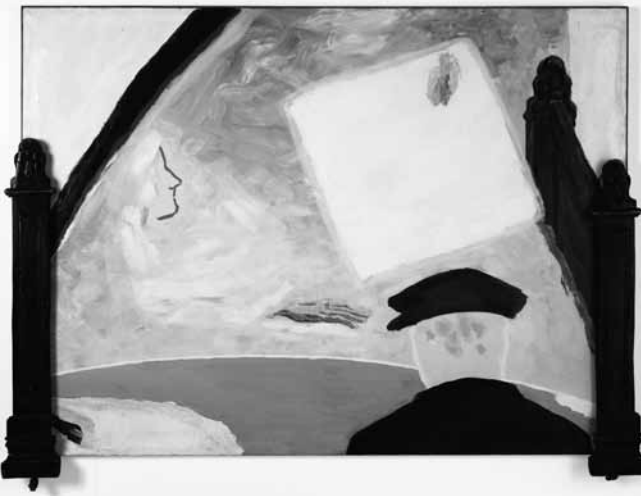
Roger Raveel, Herinnering aan het sterfbed van mijn moeder, 1965

Depuis sa naissance, la photographie est en effet fortement influencée par la peinture, d'autant plus dans un genre comme le portrait. Le pionnier en la matière fut certainement August Sander, à l'aube du vingtième siècle. Dans son célèbre et grandiose projet Menschen