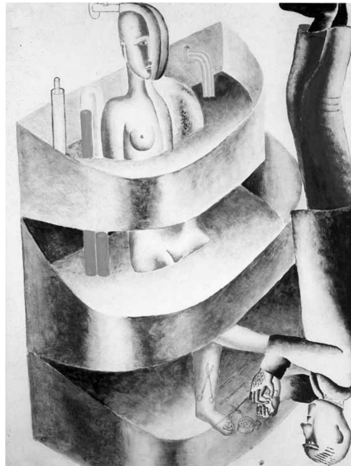
Frits Van den Berghe, De pedicure, 1926