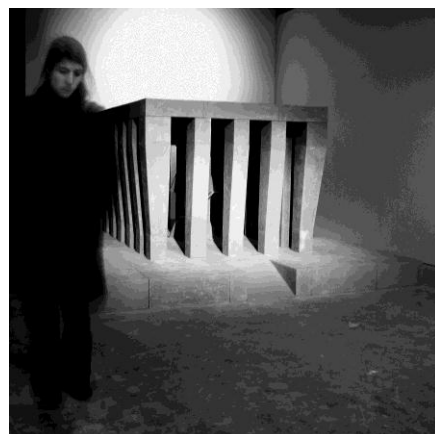
7. Renato Nicolodi, « Mausoleim 03 », 2007

Wanneer men de schaalmodellen of simulaties van Renato ervaart, is het moeilijk op welke manier zich te verhouden tegenover deze architectuur; het blijft een zoektocht naar de betekenis ervan voor de mens.