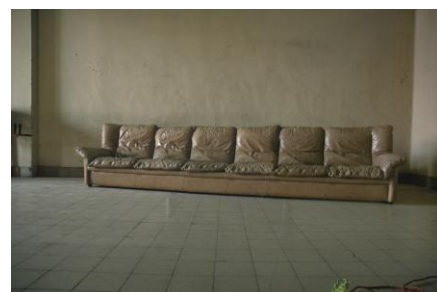
11. Leon Vranken, « Sculptuur (werktitel) », 2007

In de sculptuur die Leon maakte voor 'Just a Four-Letter Word', komen verschillende benaderingen samen: het kopiëren en verdubbelen van een geliefd object uit zijn omgeving (namelijk de gezellige zetel uit zijn atelier), een verdeling van het object in een aantal stukken (waardoor de functie ervan verstoord wordt), de ambachtelijke perfectie in uitvoering en het verrassende materiaalgebruik.