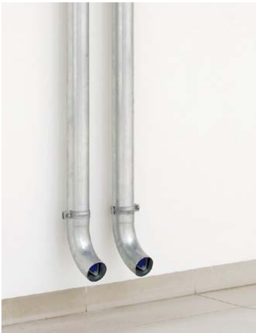
ANDREAS SLOMINSKI Where are the Skis?_ 2006 (detail) Natural slate, sheet zinc, construction wood, wood glaze, skis (Comet) _ 380 x 961 x 185 cm © Andreas Slominski