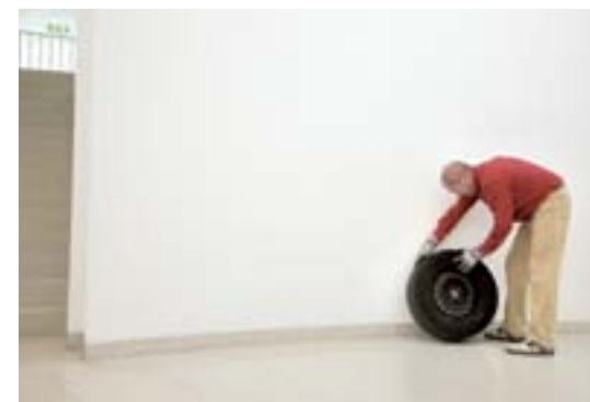
ANDREAS SLOMINSKI Taxi _ 2002 Performative Installation © Andreas Slominski