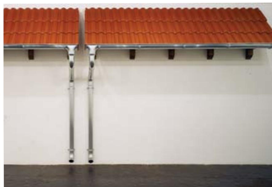
ANDREAS SLOMINSKI Where are the Skis?_ 2000 (detail) metal, synthetic, material, ski_ 2 parts, each 210 x 15-20 x 18 cm © Andreas Slominski / Private collection, Courtesy, Jablonka Galerie, Köln, DE photo: Boris Becker