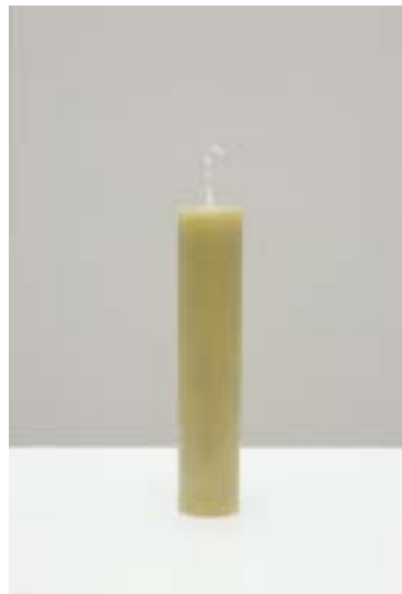
ANDREAS SLOMINSKI Candle _ 2005 Wachs, Docht _ 21,5 cm _ Ø 4 cm © Andreas Slominski

Delivery of the wax to manufacture the candle, Serpentine Gallery, London