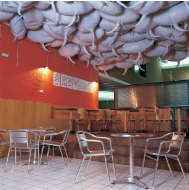
Philippe Parreno , Speech Bubbles , 1997 Mylar, helium

De tentoonstelling in het MDD, ‘Over de grens’ toont de verschillende facetten van de grensproblematiek die de Frac bestudeert. In een museumvilla die een belangrijke collectie schilderijen herbergt, lijkt het ons opportuun om werken te presenteren die weliswaar geen doeken zijn, maar die wel de schilderkunst ondervragen. De opstelling laat kunstwerken en design samenkomen waarbij (in deze context) de grenzen tussen beide disciplines compleet verdwijnen. De tentoonstelling is opgebouwd rond recente realisaties die getuigen van een zeer actuele Zeitgeist . Ze legt de nadruk op makers die in het noordelijke Europa met specifieke ontmoetingen tussen de kunstcreatie en design aan weerszijden van onze gedeelde grens bezig zijn.