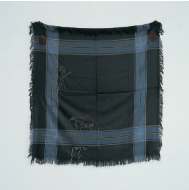
Cosima Von Bonin , Blazon of a Hashcounty (#3) , 1999 Wol, draad, katoen, 160 x 160 cm

Wat is een betere manier om het publiek met kunst te confronteren dan deze de white cube te doen verlaten, om ze te integreren en of zelfs te laten parasiteren in onze dagelijkse en gemeenschappelijke ruimtes? Deze sensibiteit van de Frac, vandaag door talrijke kunstenaars onderschreven, heeft ons gemotiveerd om een reeks werken voor de openbare ruimte te maken. ‘Camouflage’ van Nicolas Floc’h, dat eveneens voortkomt uit een uitnodiging aan de kunstenaar, is zonder twijfel een van de meest radicale antwoorden. Omdat het werk een rondpunt nodig heeft om te kunnen bestaan is het niet moge-