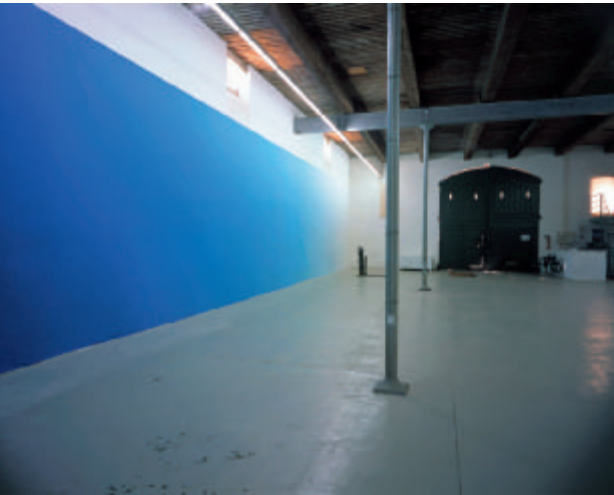
Pieter Vermeersch , blauw 0-100% , 2003