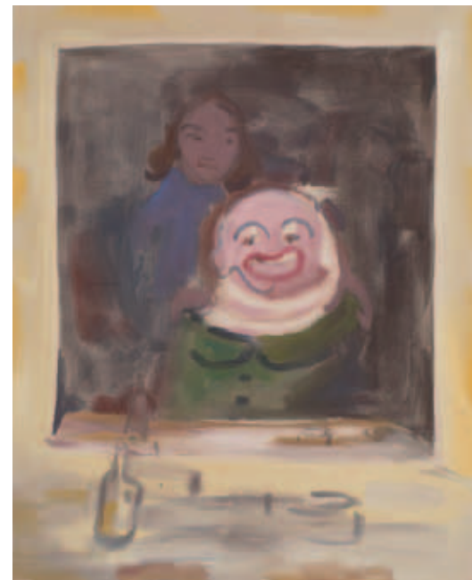
Sophie von Hellermann, Quiet Girl , 2009, acrylverf op doek, 200 x 160 cm