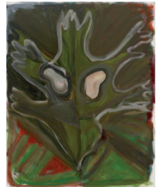
Josh Smith, Untitled , 2009