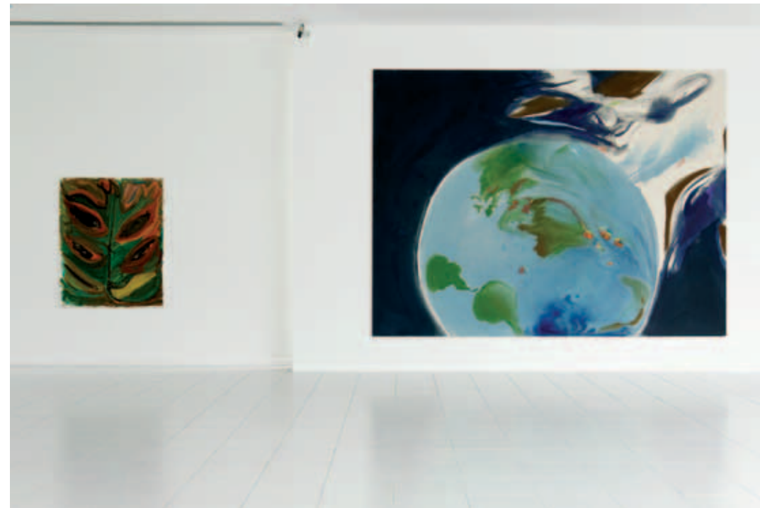
Josh Smith, Untitled , 2009, Courtesy of the artist / Sophie von Hellermann, PPHHHT , 2007, Vanmoerkerke Collection Oostende