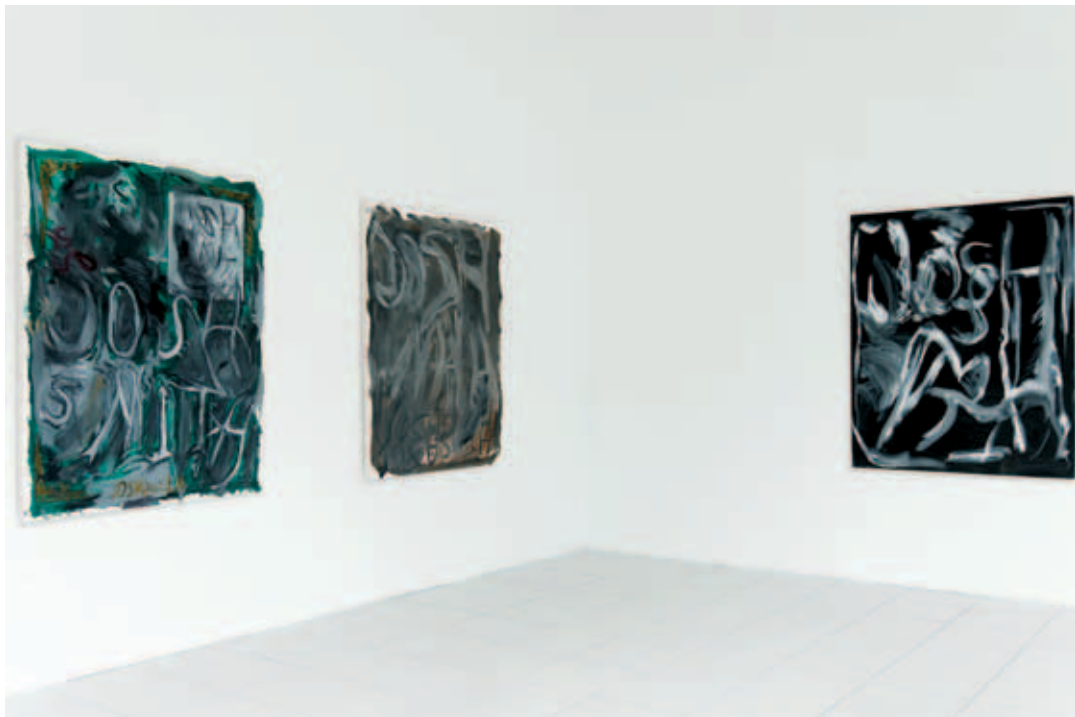
Josh Smith, Untitled , 2003, privé-verzameling België / Josh Smith, Get Down Get Brown , 2003, Courtesy Galerie Catherine Bastide / Josh Smith, Untitled , 2006, Courtesy Galerie Catherine Bastide