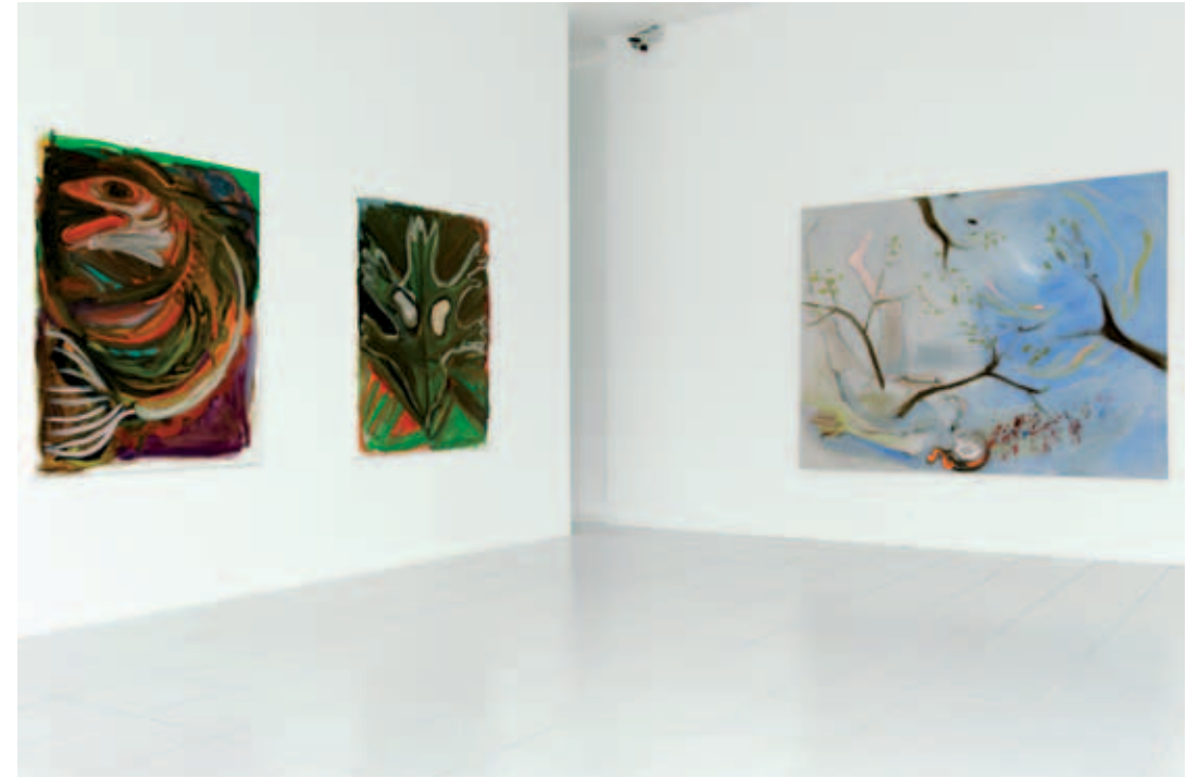
Josh Smith, Untitled , 2009, courtesy of the artist / Josh Smith, Untitled , 2009, courtesy of the artist / Sophie von Hellermann, The Drama Continues III , 2009, Courtesy Galerie Vilma Gold & Galerie Greene Naftali