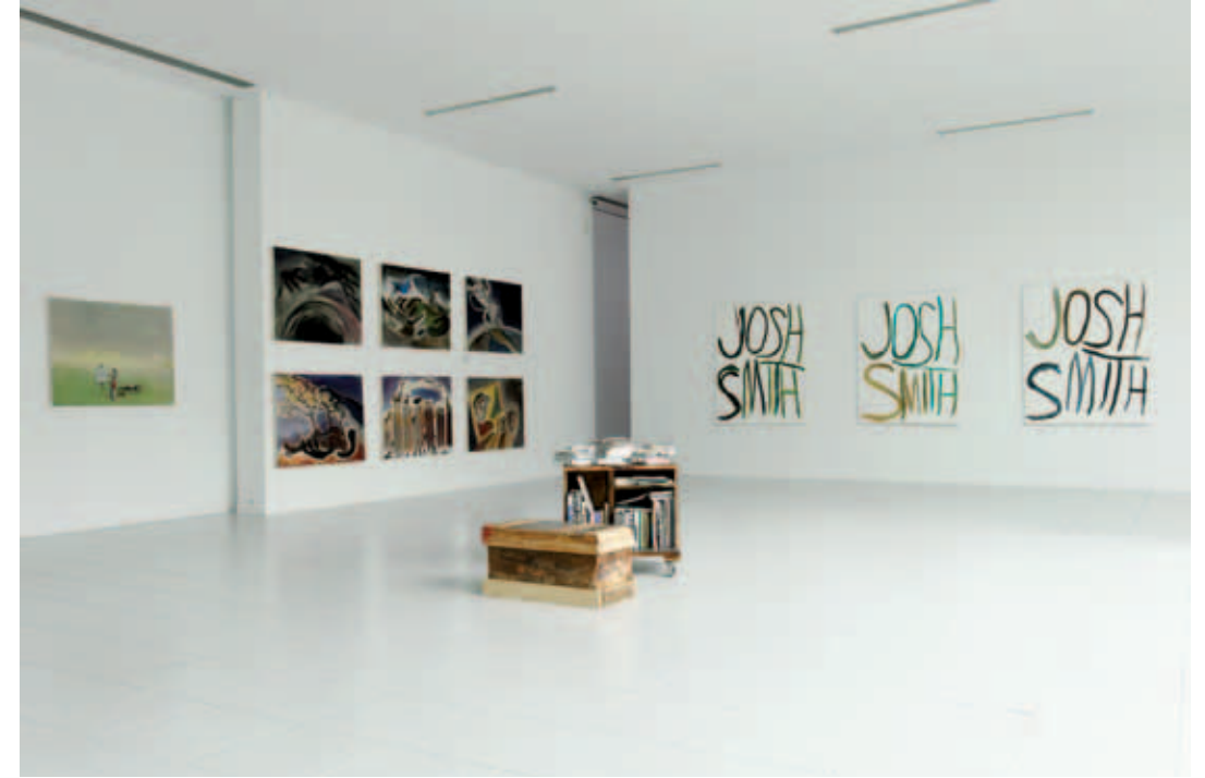
Sophie von Hellermann, Monday – Tuesday – Wednesday – Thursday – Friday – Saturday – Sunday , 2010, Courtesy Almine Rech Gallery & Gallery Greene Naftali / Josh Smith, Bookshelf / Sculpture (Le Consortium Dijon) , 2009, courtesy of the artist & Galerie Luhring Augustine / Josh Smith, Untitled , 2007, Courtesy Galerie Catherine Bastide / Josh Smith, Untitled , 2007, Privé-verzameling België / Josh Smith, Untitled , 2007, Courtesy Galerie Catherine Bastide