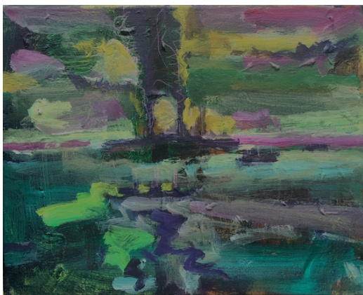
- Bloody Big Ships (Scapa Flow), 2015, 24 x 30 cm