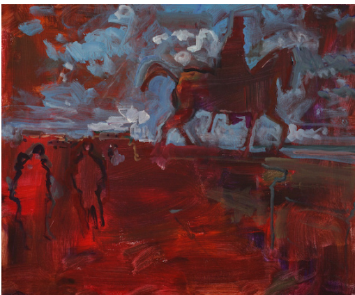
- Le travailleur de l'expansion belge, 2017, 55 x 65 cm