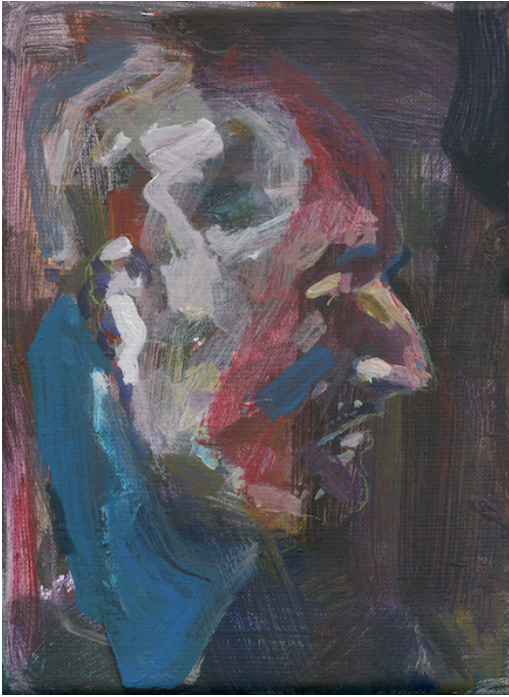
- Napoleon (dodenmasker), 2015, 24 x 18 cm