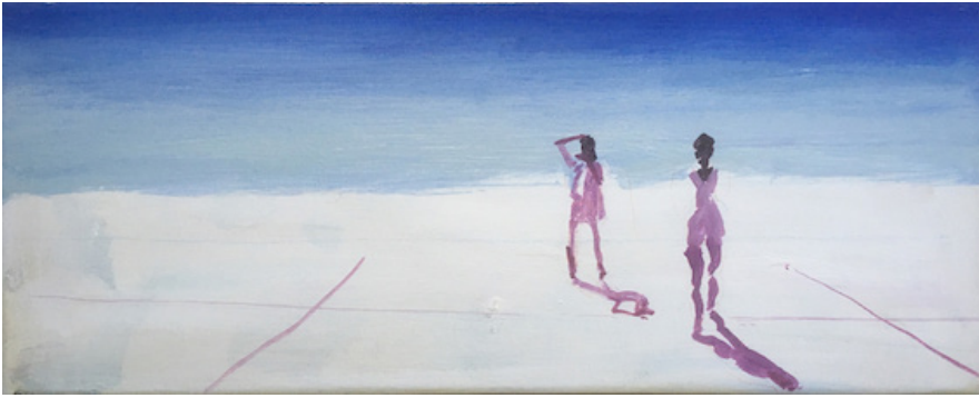
- Lafelt, 2018, 20 x 50 cm