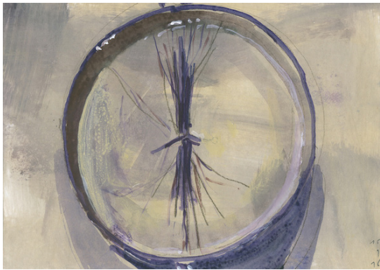
- Napoleon (haarlok), 2016, 18 x 24 cm