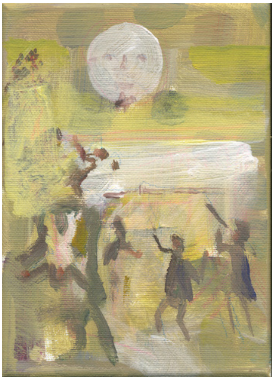
- Maanleger (Turnhout), 2017, 18 x 13 cm