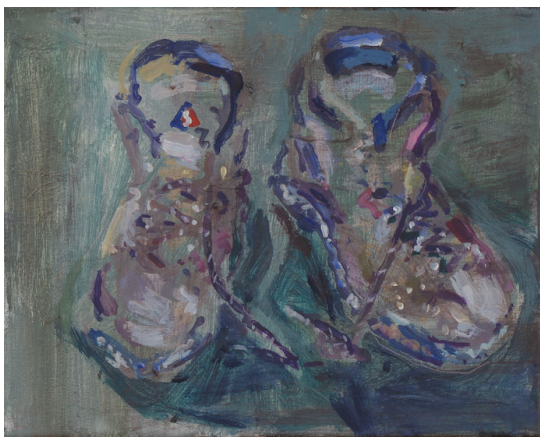
- Wandelschoenen (Schotland), 2016, 24 x 30 cm