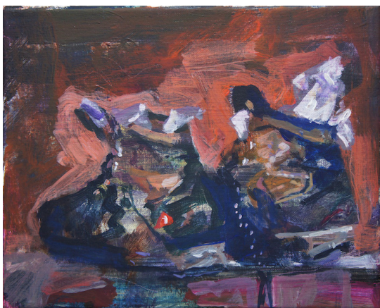
- Wandelschoenen (Tielentheide), 2017 24 x 30 cm