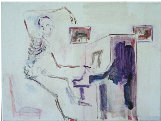
- Squelette à l'harmonium (James Ensor), 2018, 30 x 40 cm