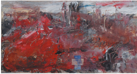
- leper, 1990, 21,5 x 40 cm