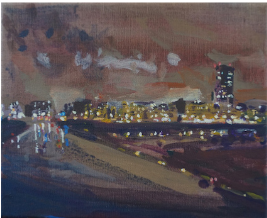
- Winternacht (Oostende), 2019, 22 x 27 cm