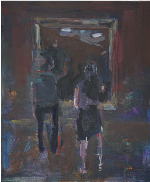
- Waarom is Permeke zo zwart?, 2017, 65 x 54 cm