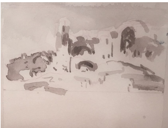
- De reizen van Franz Cumont, 2019, 5,6 x 9,5 cm