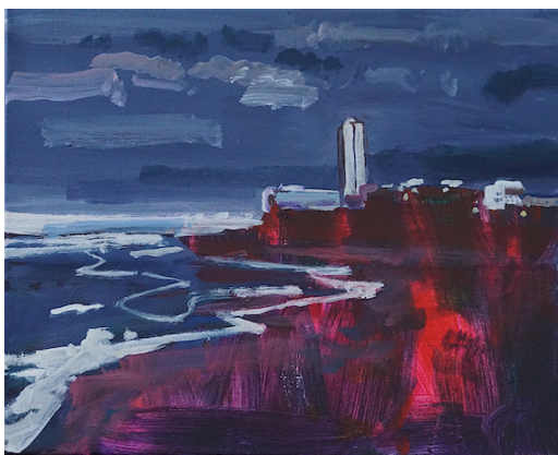
- Oostende, 2019, 40 x 50 cm